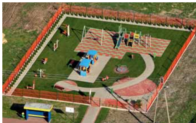
Plac zabaw w Cieślówicach Dużych

Wracając do rankingu, to nie o miejsce tu chodzi, ale o możliwości, jakie dają nam projekty zrealizowane, w okresie 2011–2015.