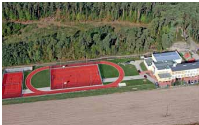
Zespół Szkół w Wiadernie