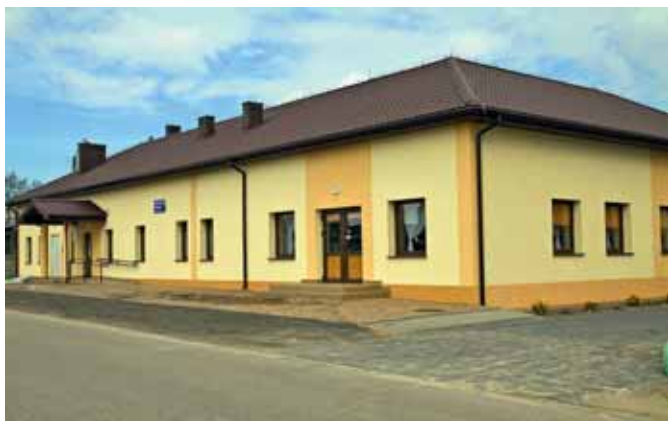
Świetlica wiejska w Komorowie