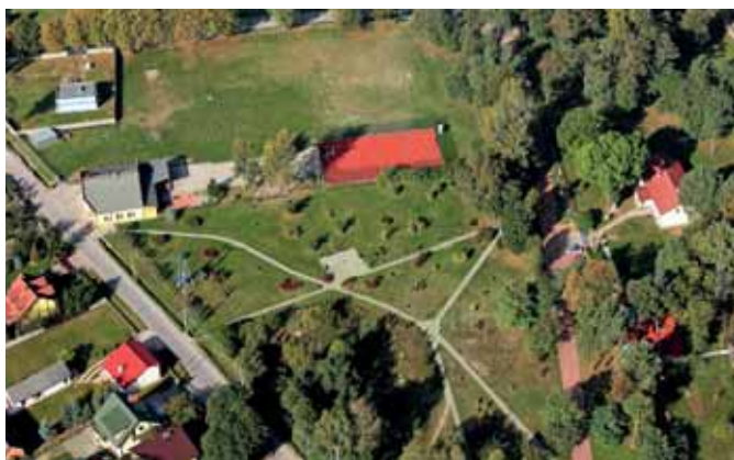
Park w Wąwale