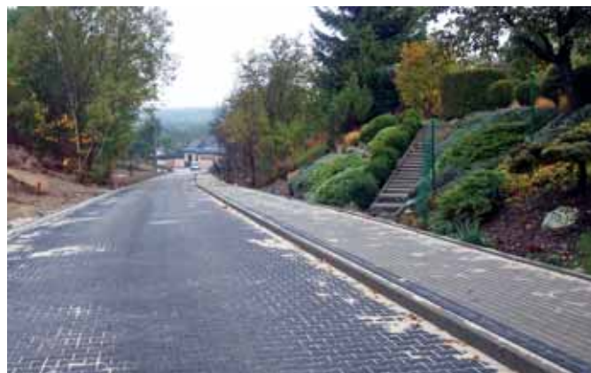
Smardzewice ul. Ogrodowa