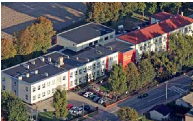
Zespół Szkolno-Przedszkolny SP w Smardzewicach