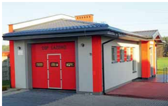
Strażnica OSP w Łazisku