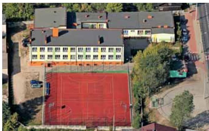
Zespół Szkół w Komorowie