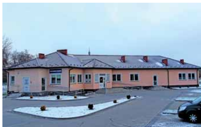
Przychodnia Rodzinna w Smardzewicach