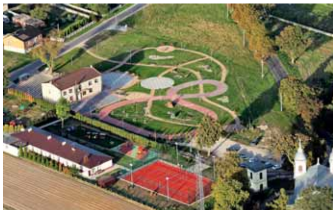
Szkoła, boisko i zagospodarowanie terenu w Chorzęcinie