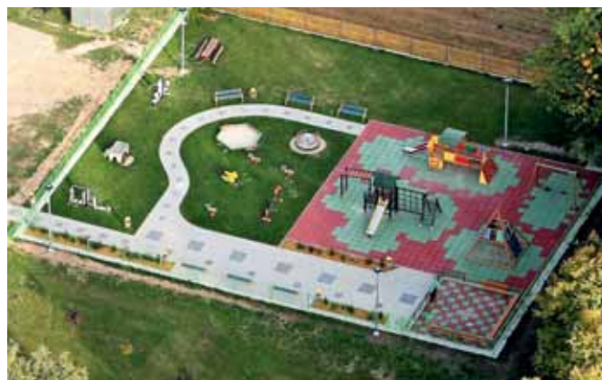
Plac zabaw w Twardej