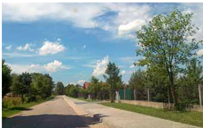
Chodnik w Karolinowie

Poza inwestycjami z udziałem środków zewnętrznych realizowaliśmy sporo projektów z funduszy własnych np: