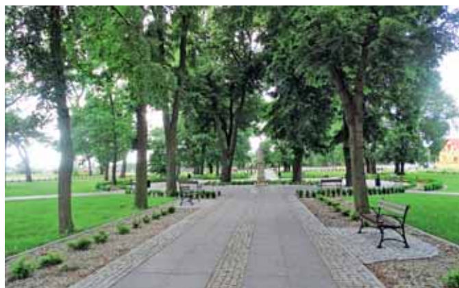
Park w Smardzewicach