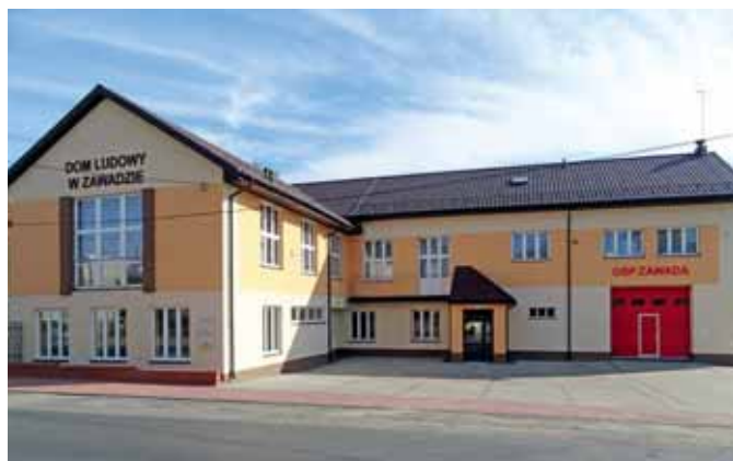
Dom Ludowy w Zawadzie