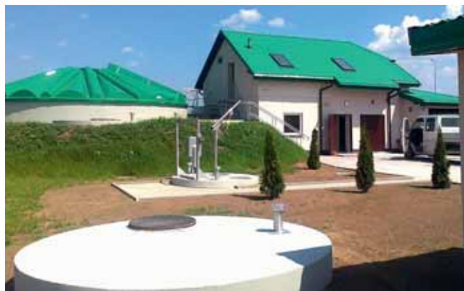
Oczyszczalnia ścieków w Zawadzie