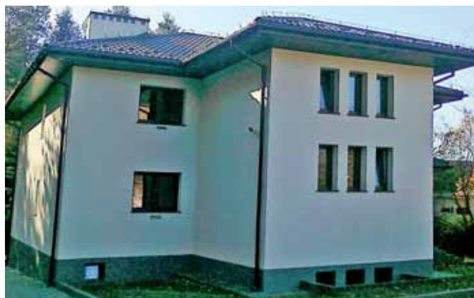
Budynek komunalny w Smardzewicach